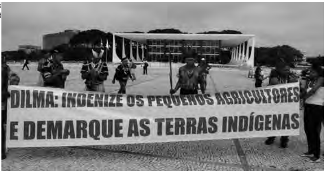
A morosidade para devolver aos povos indígenas as suas terras tradicionais causa o acirramento de conflitos mesmo em áreas em que a situação já está pacificada