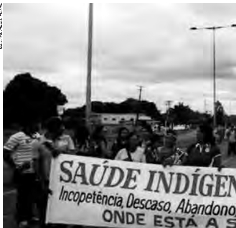
Em protestos em todo o país, os povos questionam o destino dos recursos direcionados à saúde