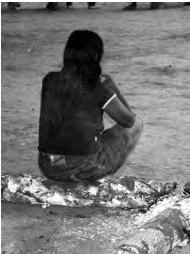
Grave violação de direitos humanos, a violência sexual também impacta as populações indígenas