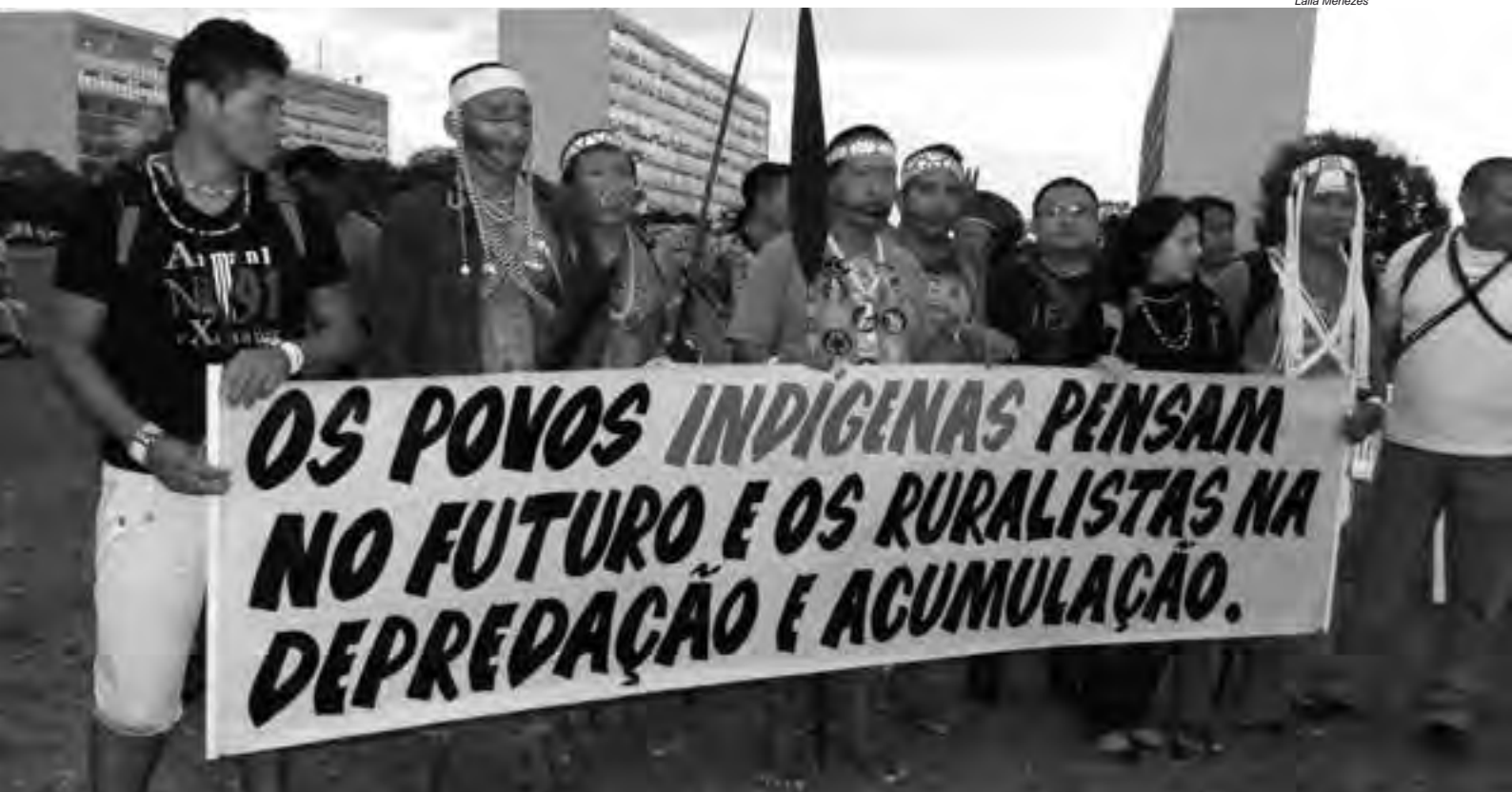
Os povos indígenas têm valores e projetos de vida totalmente distintos dos que são comuns na sociedade ocidental, fundamentada no capitalismo e na mercantilização da vida