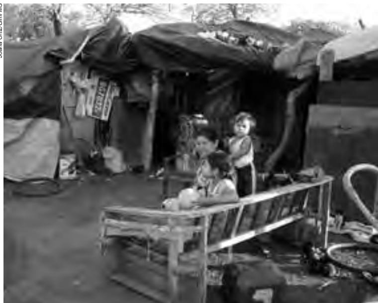
Acampados na beira de estradas por décadas, os indígenas vivem em condições degradantes, mas não desistem da luta por seus territórios ancestrais

da Constituição Federal e das normas infraconstitucionais. O Poder Legislativo, além de dar sinais de subserviência a grupos econômicos, não promove a fiscalização sobre o Poder Executivo para que este cumpra suas atribuições, resguardando os direitos indígenas e coibindo a exploração das terras indígenas e a expropriação de seus bens naturais, como a água, a madeira e os minérios.