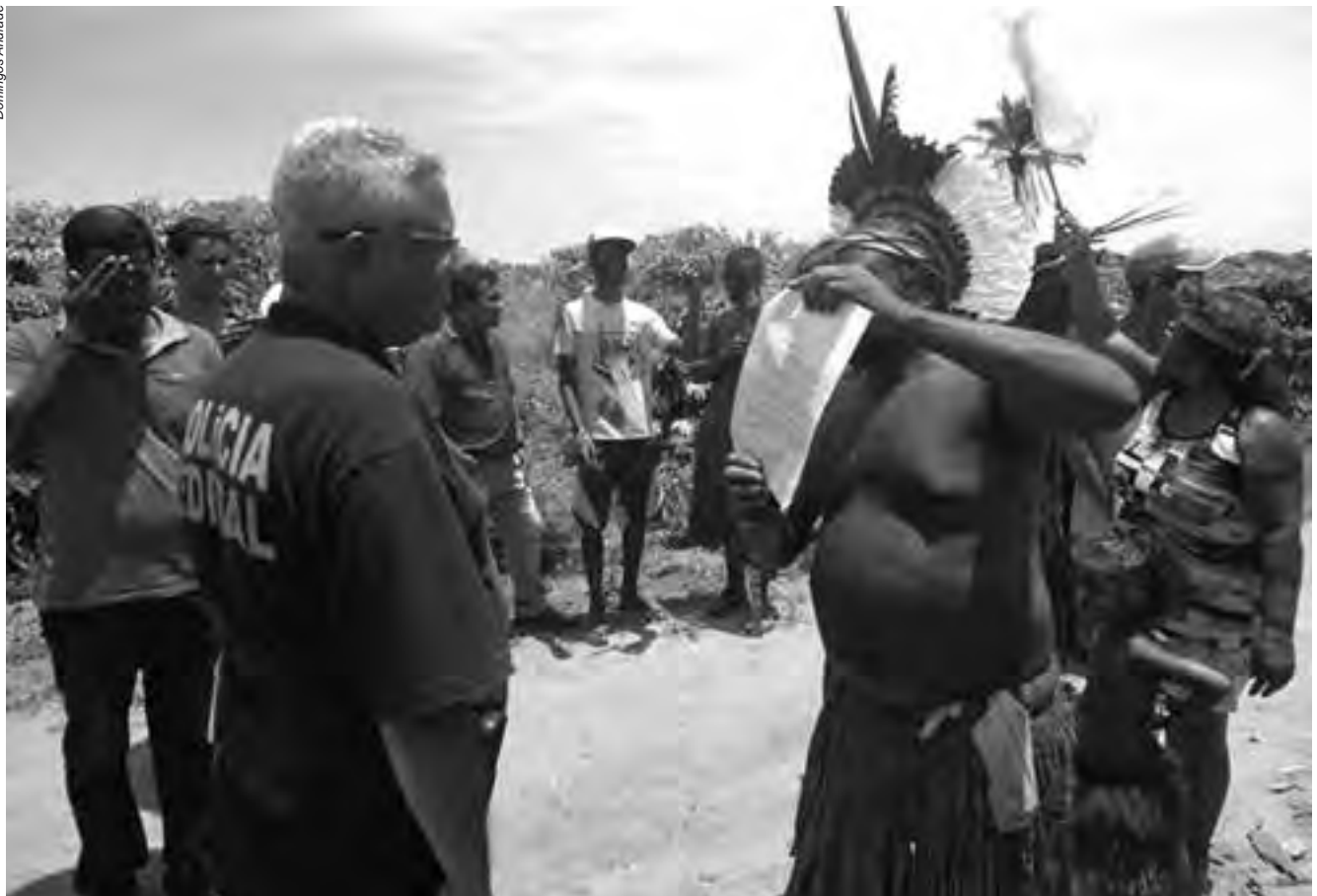
Cada vez mais os territórios indígenas são alvo do interesse de grupos econômicos e políticos que não se constringem em utilizar a força física para garantir o acesso e a exploração de seus bens naturais

No estado da Bahia, o povo Pataxó, da Terra Indígena Barra Velha, foi alvo de uma ação truculenta de forças policiais na execução de uma reintegração de posse. Segundo denunciaram os Pataxó, efetivos das polícias Federal, Civil e Militar dispararam balas de borracha e bombas de gás lacrimogêneo sobre os indígenas. Segundo relatos, não foram poupadas crianças, mulheres, nem idosos. Muitas pessoas tiveram de se refugiar nas matas para fugir do ataque policial. O conflito ocorreu devido à morosidade do poder público em reconhecer o território indígena. A Terra Indígena Barra Velha do Monte Pascoal, situada nos municípios de Porto Seguro, Prado e Itamaraju, região do extremo sul da Bahia, é área tradicionalmente ocupada pelos Pataxó, conforme vários relatos históricos desde 1.500, e tem um território de 8.627 hectares delimitado e homologado, conforme processo realizado pela Funai. Entretanto, os indígenas reivindicam 52.748 hectares, área que incide no Parque Nacional do Monte Pascoal, sobreposto à terra indígena.