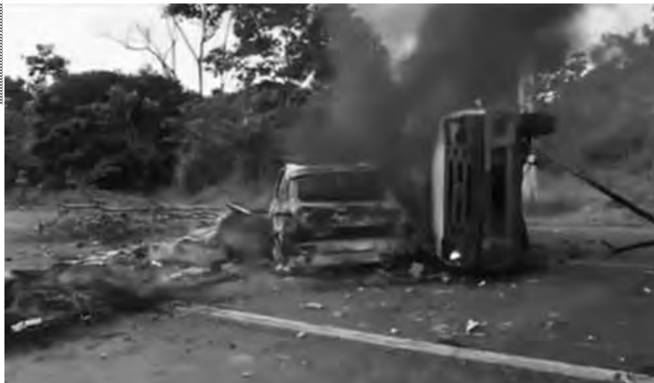
Os atos racistas praticados cotidianamente contra os indígenas em diversas partes do Brasil deixam transparecer o desejo de exterminar aqueles que insistem em ser diferentes

Por fim, deve-se reconhecer que o racismo contra os povos indígenas se expressa tanto por meio de ações de pessoas e grupos, quanto pela omissão do Estado frente às violências praticadas e às reivindicações destes povos para que seus direitos constitucionais sejam respeitados. A violência não decorre da inexistência de mecanismos legais, mas da falta de efetividade destes, agravada imensamente pela inoperância do governo no que tange às demarcações das terras indígenas. Os conflitos fundiários respondem, em larga medida, pelas manifestações anti-indígenas registradas e pela intensificação de uma vontade de exterminar aqueles que, em processos de luta, insistem em manter-se na diferença. ♦