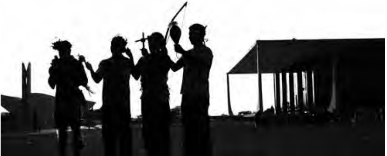
Recentes decisões do Judiciário consideram e tratam os povos como se eles ainda fossem tutelados pelo Estado, afrontando a própria Constituição Federal do país

“esbulho renitente”. Na esteira do ataque frontal ao direito fundamental dos povos às suas terras, estas decisões da 2ª Turma do STF também restringem drasticamente o conceito de “esbulho renitente”. De acordo com as referidas decisões, somente a “existência de situação de efetivo conflito possessório” na data da promulgação da Constituição configuraria a ocorrência de “esbulho renitente”. De forma ainda mais afunilada e fundamentalista, a 2ª Turma do Supremo diz que “esse conflito deve materializar-se em circunstâncias de fato ou controvérsia possessória judicializada”.