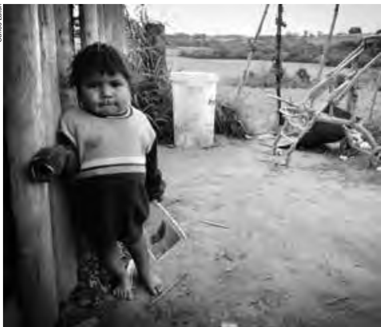
Em muitos acampamentos, as novas gerações não têm a oportunidade de viver o Nande reko, o modo tradicional de viver, de ser indígena

DESCRIÇÃO: O processo demarcatório encontra-se na fase de conclusão do levantamento fundiário e no início da desintrusão. Porém, já se passaram quase três anos e a Funai não publicou o resultado do levantamento. O governo estadual, que também tem responsabilidades, não promove o reassentamento ou a indenização das terras ocupadas por agricultores. A comunidade sofre com pouco espaço para as crianças viverem e com a impossibilidade de plantar, coletar material para artesanato e lenha. Essa situação aumenta o clima de tensão entre agricultores e indígenas.