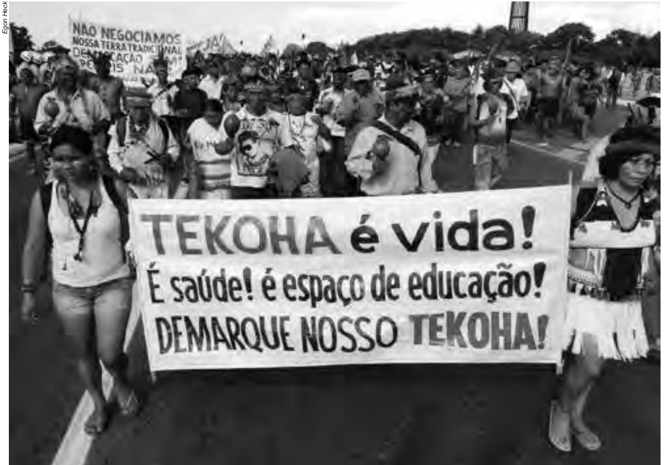
A demarcação das terras indígenas deve ser a primeira ação de reconhecimento da dívida histórica que o Brasil tem com seus povos originários

contestações e 60 dias para análise da Funai, o procedimento demarcatório ainda aguarda a portaria declaratória, a ser assinada pelo ministro da Justiça. Já são cinco anos de espera.