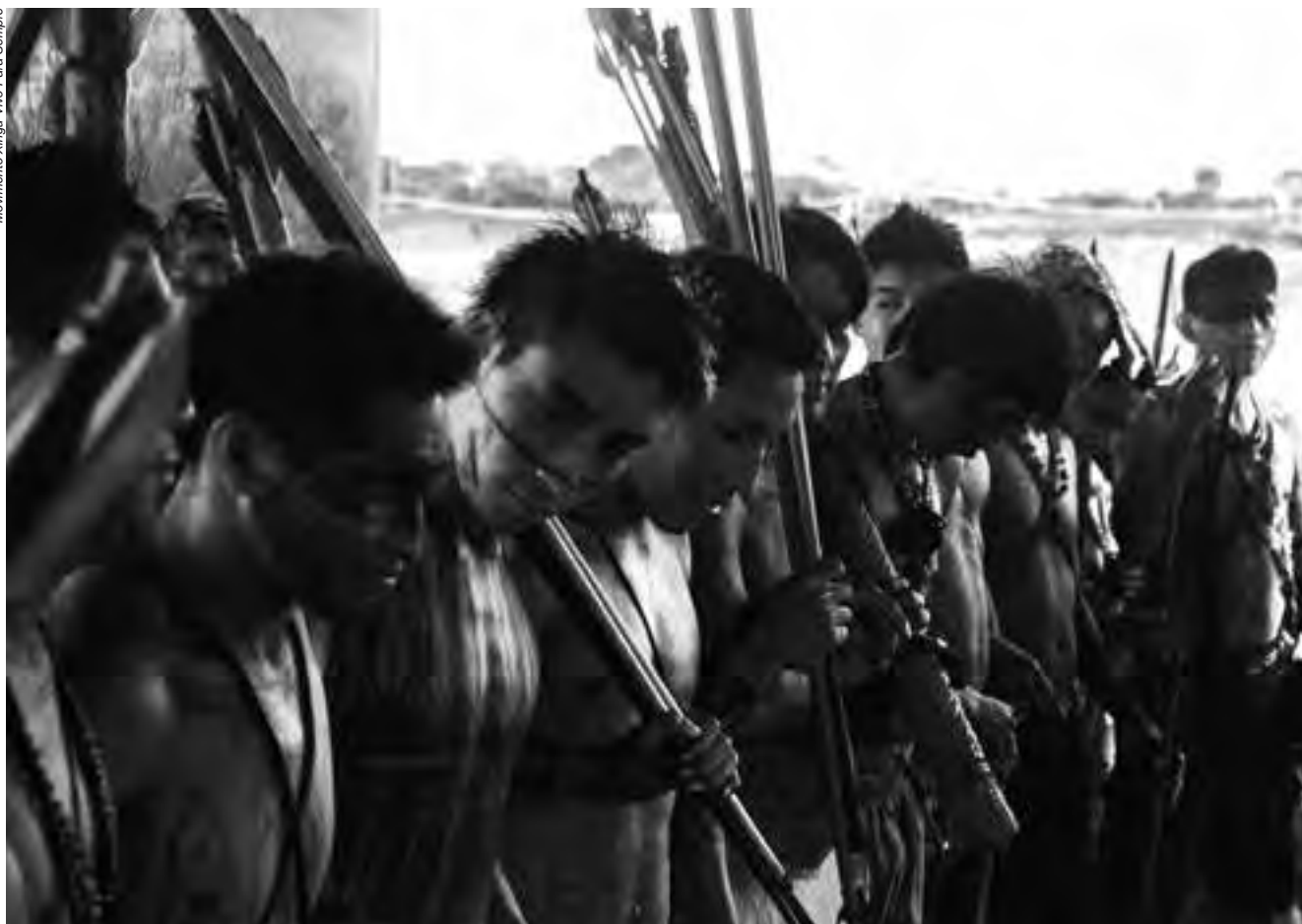
Lideranças Munduruku que participavam de protestos na cidade de Jacareacanga pela melhoria da educação escolar indígena foram ameaçados por moradores locais e atingidos por rojões