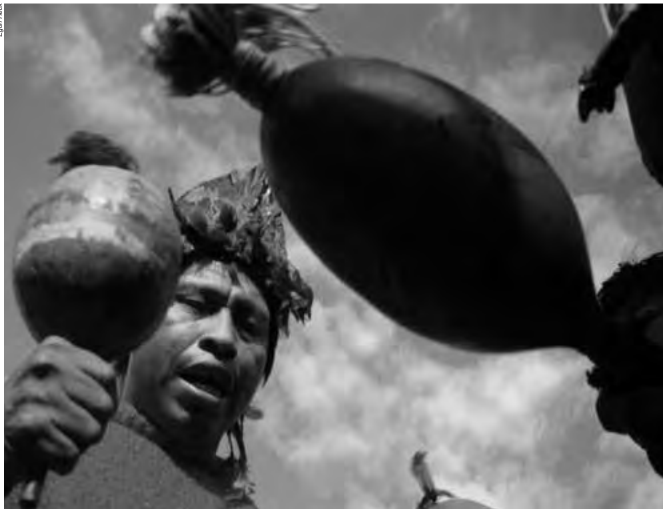
No Brasil, indígenas ainda morrem por falta de assistência básica, de medicamentos, devido ao consumo de água imprópria e por doenças de fácil tratamento

Contudo, os medicamentos, a infraestrutura para o atendimento e a equipe técnica não eram suficientes para prestar o devido atendimento ao conjunto dos enfermos. Segundo o CTI, seriam necessários mais médicos, técnicos de enfermagem, medicamentos, viaturas e medicamentos para conter o cenário. Segundo dados oficiais, nove indígenas vieram a óbito entre os dias 25 de novembro e 16 de dezembro. Os Canela, no entanto, consideram este número subestimado e afirmam que 19 indígenas faleceram nesse período. Cerca de 310 indígenas estavam recebendo tratamento.