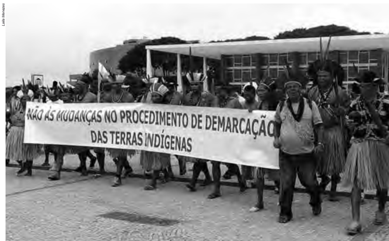
Apenas 34% dos recursos destinados a ações, como a de demarcação dos territórios indígenas, foram liquidados em 2014, evidenciando que a disputa é, acima de tudo, política