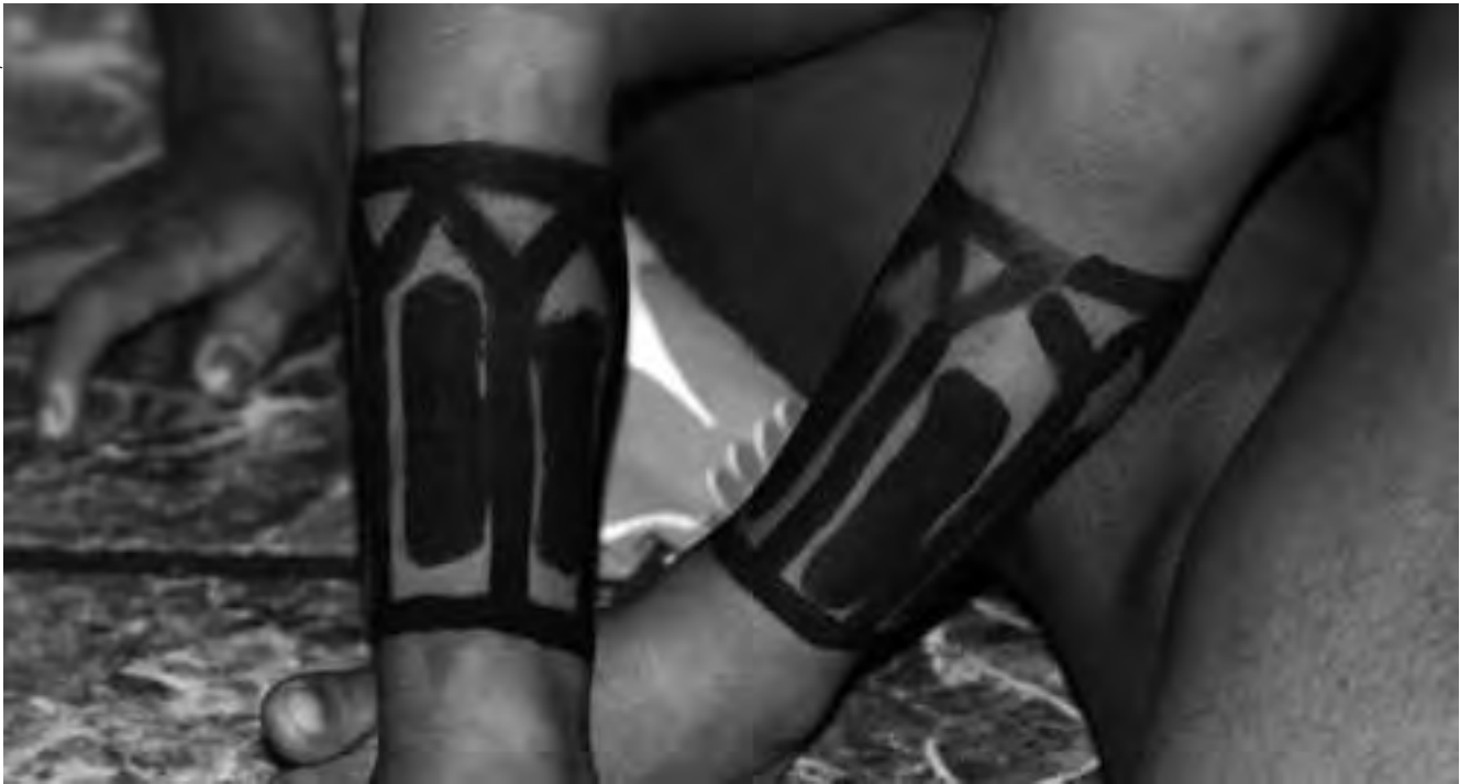
A taxa de mortalidade infantil de indígenas é muito superior à da média nacional. Enquanto entre os Xavante ela foi de 141,64 por mil nascidos, a média no país em 2013 foi de 17 por mil