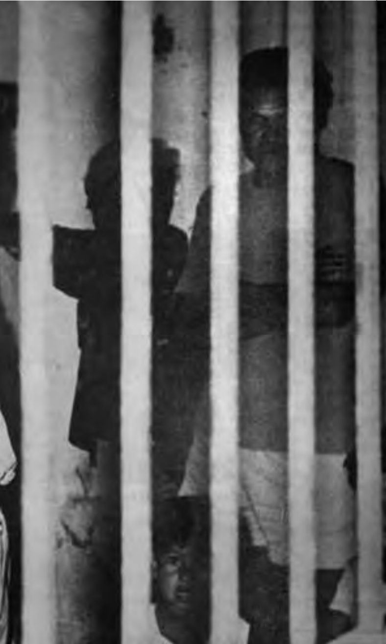
Espancamento e confinamento compunham o cotidiano da colônia penal, que foi denunciada pelo jornal Porantim , na época, como um “Campo de Concentração Indígena”

e humanista, no geral”, e avaliaram que a fazenda não era adequada para uma área indígena. Consta nesse relatório que eles identificaram 49 Krenak, 35 Pataxó, três Guarani, além de indígenas de outras etnias, como Xerente e Pankararu. Parte do grupo Guarani já havia retornado ao Espírito Santo.