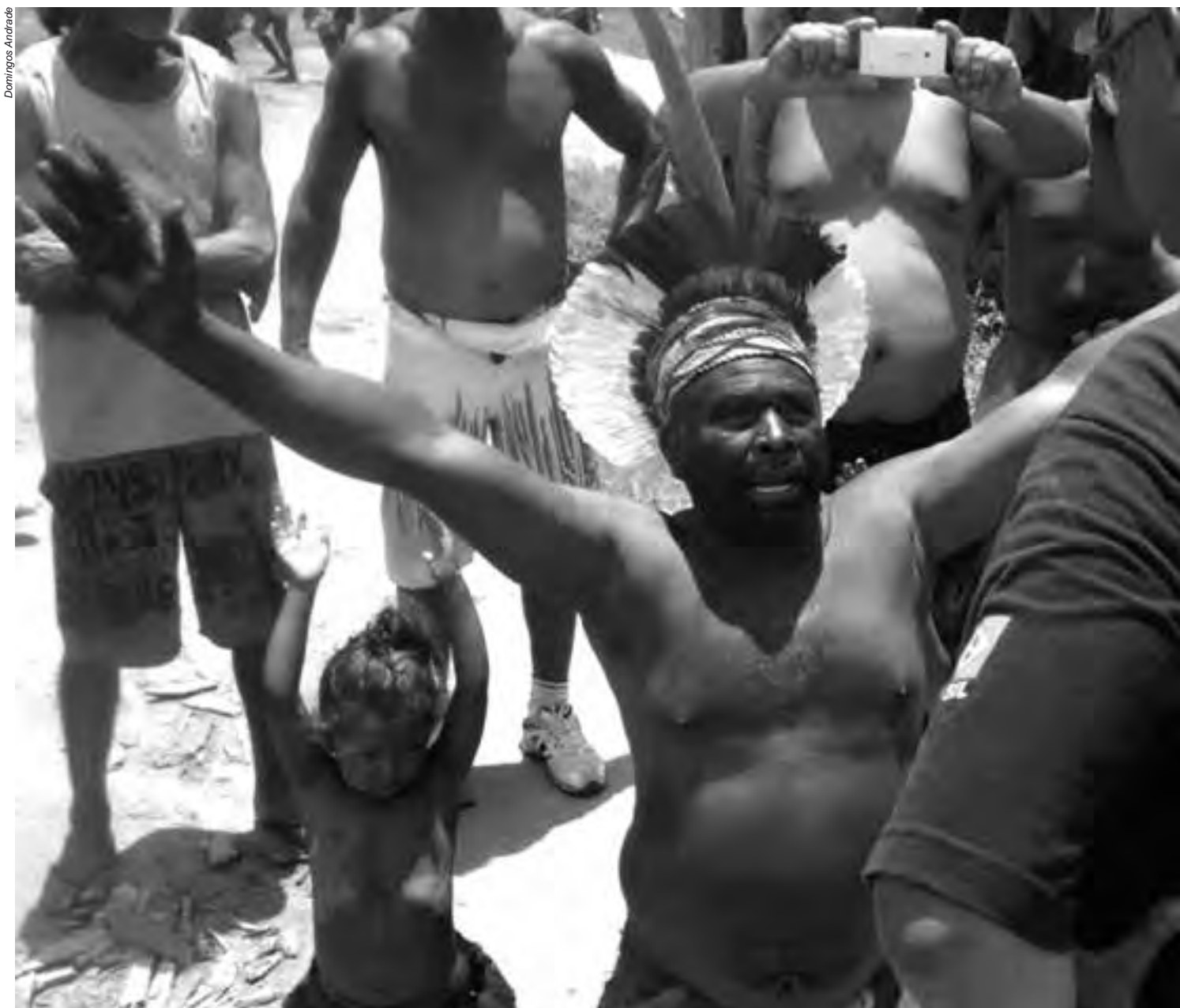
No Brasil, de modo geral, ainda não há a compreensão de que os direitos das minorias devem ser respeitados e os deveres constitucionais cumpridos; as terras tradicionais

pesado, cavalaria montada, 70 viaturas, policiais acompanhados de cães, helicópteros e Corpo de Bombeiros. Assim como ocorreu na ocasião da prisão de cinco lideranças, que nem estavam no local do confronto, o Grupo RBS e outros veículos de imprensa estavam acompanhando a polícia. Por outro lado, inexplicavelmente, o órgão indigenista estatal não foi informado da megaoperação na área indígena. Os policiais adentraram as casas a partir das seis horas da manhã, mas não encontraram nada. Levaram o veículo de um morador da aldeia e fotografaram todos os homens da comunidade, incluindo os adolescentes. Além disso, obrigaram todos a fornecer saliva, possivelmente para a realização de análise genética.