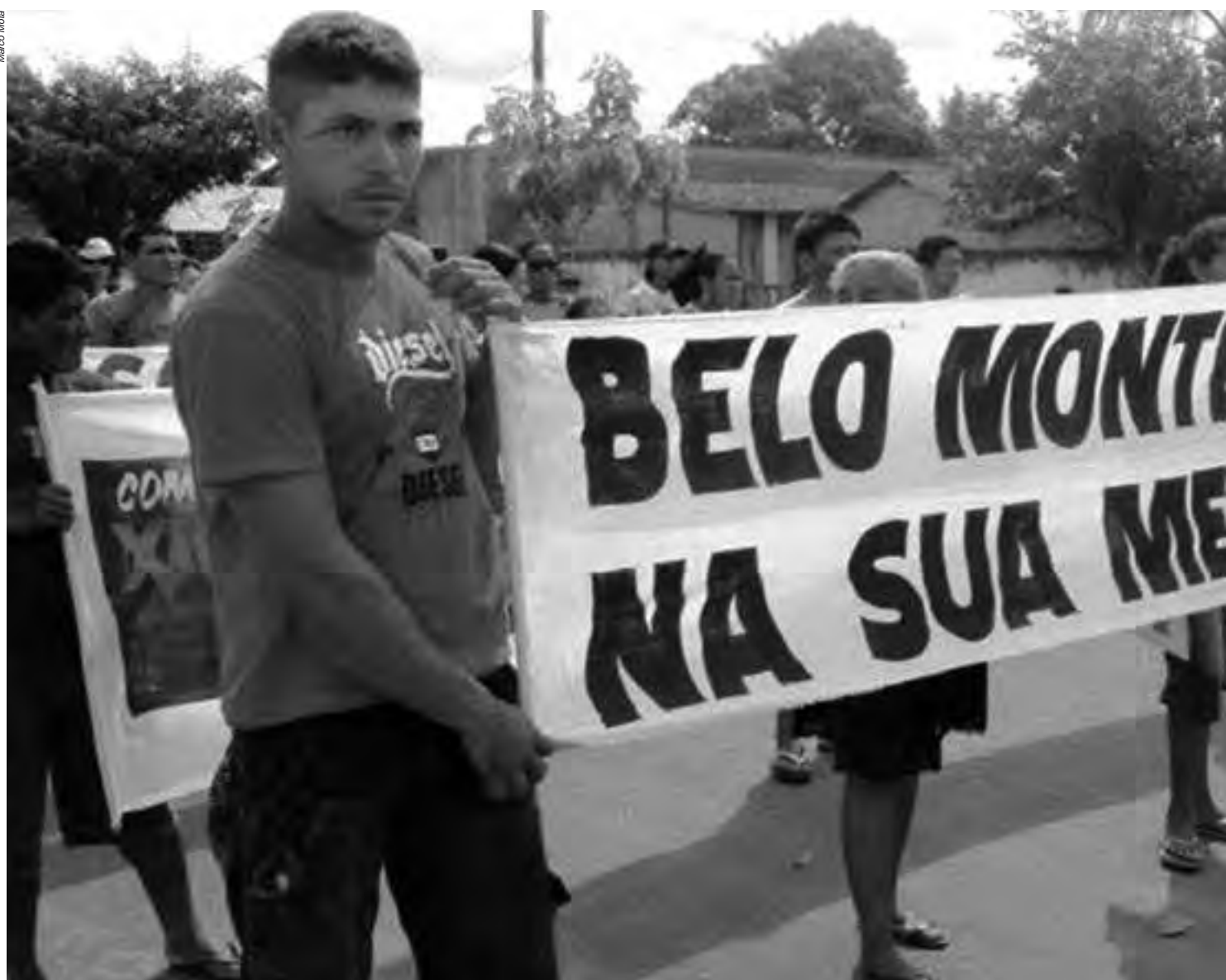
Desde a época da ditadura os povos indígenas são considerados obstáculos ao “desenvolvimento”; sempre houve também, por parte dos mais diversos grupos

o parágrafo 6º do Artigo 231 da CF, a fim de restringir o uso exclusivo dos índios sobre suas terras. Ainda em 2012, a Advocacia Geral da União (AGU) publicou a Portaria nº 303, com o argumento de “Salvaguardas Institucionais às Terras Indígenas, conforme entendimento fixado pelo Supremo Tribunal Federal na Petição 3.388 RR”. Através desta portaria, o Executivo federal buscou aplicar a todas as terras indígenas o entendimento do STF exclusivo para o processo de demarcação da Terra Indígena Raposa Serra do Sol (RSS), ficando explícita intenção de restringir os direitos indígenas