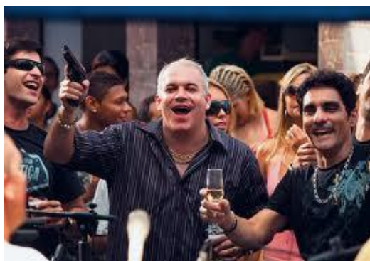
Figura 8: Milicianos comemorando o sucesso dos negócios.