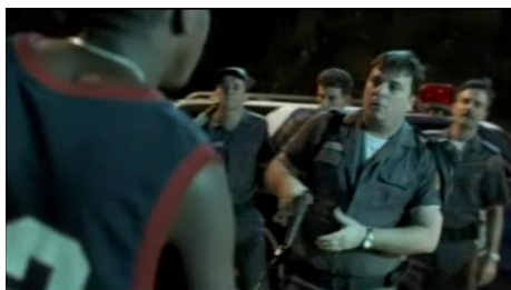
Figura 1: Policiais buscam o arrego do tráfico jogo do bicho no Morro da Babilônia.

A película Tropa de Elite destaca a extorsão cometida pela polícia quando busca o arrego 4 do tráfico, do jogo do bicho e arrecadando propinas de estabelecimentos, quanto, no caso específico da polícia, propinas dos próprios policiais para garantirem seus direitos. Portanto, vemos que os policiais fazem também coação com os comerciantes. Sejam eles do mercado legal ou do ilegal.