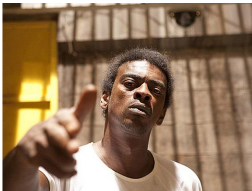
Figura 5: Seu Jorge interpretando “Beirada” traficante preso em Bangu I – personagem inspirado em Fernandinho Beira Mar que comandou em 2002 uma grande rebelião.

Esta passagem ilustra, de maneira geral, a utilização dos presos para cometerem extorsões, devido as altas cifras que estes movimentam fora dos presídios, utilizando-os como “moeda de troca”.