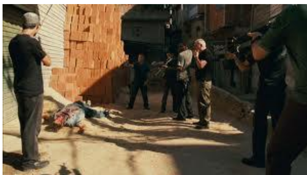
Figura 7: Milicianos e seu marketing, execução sumária 7 .

No filme, os traficantes já cobravam taxas por determinados serviços nas comunidades, ou seja, já praticavam a extorsão. A apresentada na película é a taxa do "gato net" (televisão a cabo) expressa pelo traficante quando o Capitão Rocha sobe para pegar o arrego do tráfico.