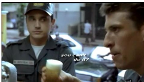
Figura 3: Capitão Fábio busca propina no bar.

É possível verificar a cena de extorsão institucional, ou seja, os próprios policiais são perpetuadores de práticas extorsivas contra seus próprios agentes. No filme, por exemplo, vemos a cena em que o Sargento Rocha, constrange o Soldado Paulo a pagar-lhe propina para liberar suas férias, que o soldado já aguardava há quatro anos. E o Sargento Rocha pronuncia seu famoso chavão "quem quer rir, tem que fazer rir".