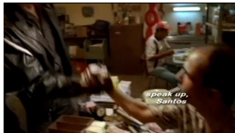
Figura 2: Policial busca o arrego do jogo do bicho