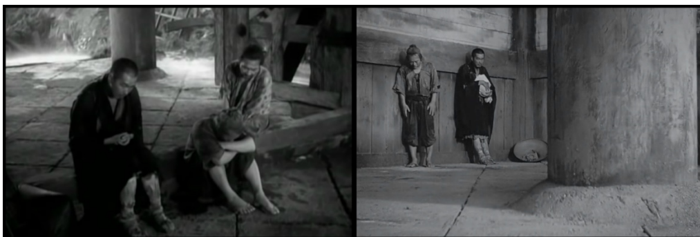
Figura 5 - Lenhador e Monge se mostram desolados.

Para Bakhtin (2003), a “introspecção-confissão” compreende a rejeição de um juízo divino ou humano, com tom desconfiante, colérico, havendo provocação e sinceridade. Percebe-se este tipo de discurso no filme, tanto no Monge quanto no Lenhador , principalmente porque de acordo com Yamashiro (1985), na era Heian , havia a propagação do pensamento chamado “Fim da Lei”. Este era proveniente da escritura budista de que, após dois mil anos da morte de Buda, haveria uma degeneração do homem e da humanidade porque os ensinamentos dele perderiam o poder. Como neste período passou a haver sofrimento generalizado, causado por um desleixo da administração, surgiram mais perturbadores da ordem pública, crentes na ideia de “Fim da Lei”. O Monge aparenta ser uma destas pessoas pessimistas com o “Fim da Lei” (Figura 5).