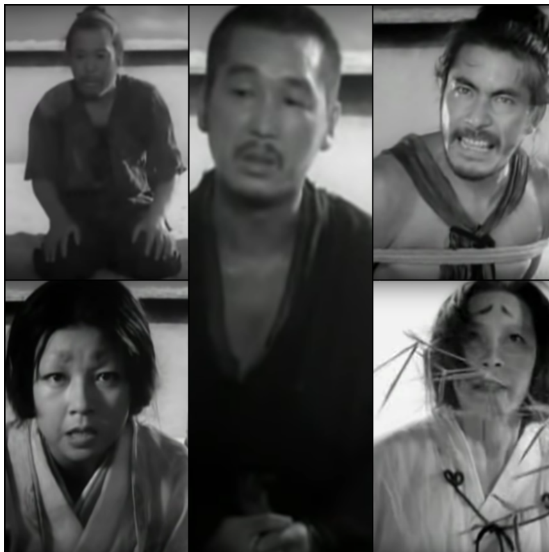
Figura 1 – Depoimentos do Lenhador, da Esposa, do Monge, do bandido Tajomaru e da Médium.

A questão, quase literalmente, não é tanto a cor do rosto que aparece na imagem, mas a voz social real ou figurativa que fala "através" da imagem. Menos importante que a "acuidade mimética" do filme é sua capacidade de transmitir as vozes e perspectivas da comunidade ou comunidades em questão. (STAM; SHOHAT, 2006, p. 310).