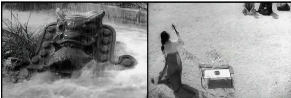
Figura 2 - Estátua xintoísta antes do depoimento da Médium e o ritual realizado por ela.

os homens mortos não mentem. Observa-se, em antecipação ao depoimento da Médium, a imagem de uma estátua caída no chão sendo banhada pela chuva antes de se iniciar o depoimento (Figura 2), visto que nos santuários xintoístas, usualmente, uma estátua os guarda.