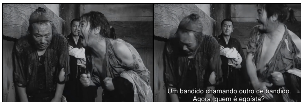
Figura 3 - O Lenhador é desmascarado e sente-se envergonhado.

Ao final da trama, o Lenhador assume estar com a fachada errada, sentindo-se constrangido e inferior, perdendo por um momento a reputação (Figura 3), pois a versão dos fatos que sustentava começa a cambalear, a desabar, trazendo constrangimento e mortificação, assim o personagem exprime uma fachada envergonhada. Goffman (2011, p. 16) relata o que acontece nesses casos: “[...] estar com a fachada errada ou fora de fachada para a fachada envergonhada pode adicionar mais desordem para a organização expressiva da situação”.